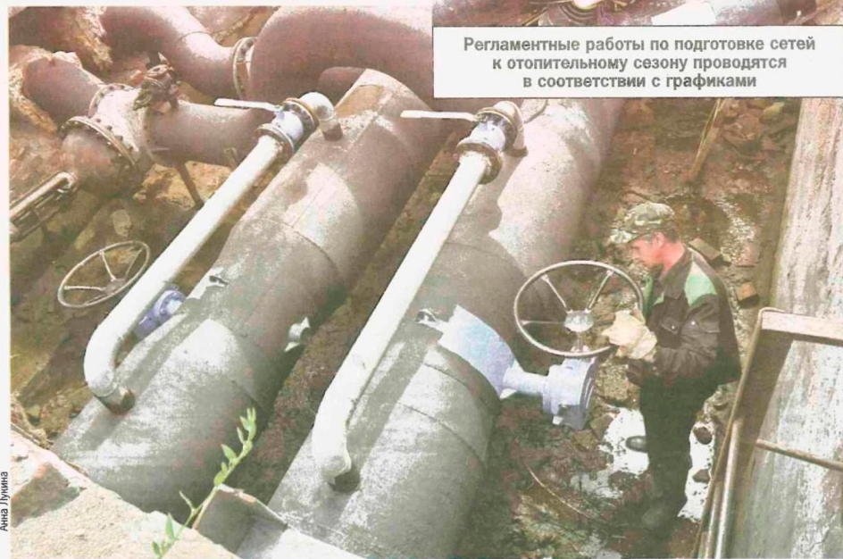
Регламентные работы по подготовке сетей к отопительному сезону проводятся в соответствии с графиками

сети, производят их капитальные ремонты, а в силу дефицита городского бюджета (предприятие давно самоокупаемо) постоянно внедряют новые технологии и расширяют свои внутренние ресурсы, стараясь идти в ногу со временем.